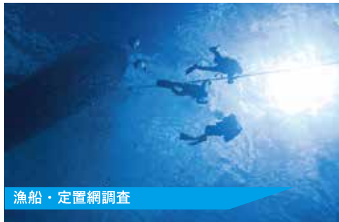
漁船・定置網調査