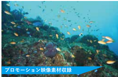
プロモーション映像素材収録